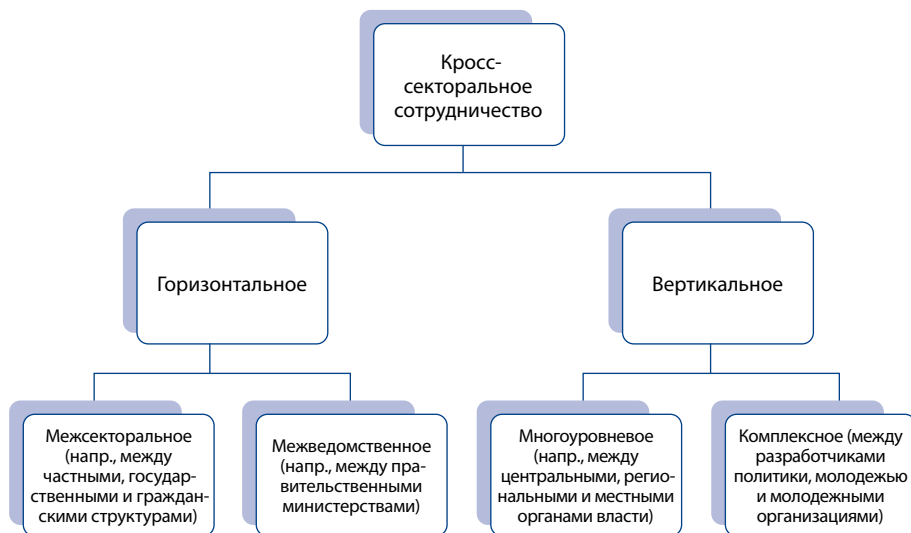
Рис. 3. Типология кросс-секторального сотрудничества

разные термины: межсекторальные, кросс-секторальные, межведомственные, сквозные, комплексные, межинституциональные. Главным общим знаменателем здесь является тот факт, что в кросс-секторальное сотрудничество вовлечены различные группы и институты, не ограничивающиеся традиционными и государственными субъектами стратегического управления. Существует по меньшей мере два различных способа развития кросс-секторального сотрудничества — горизонтальный и вертикальный, см. рис. 3.