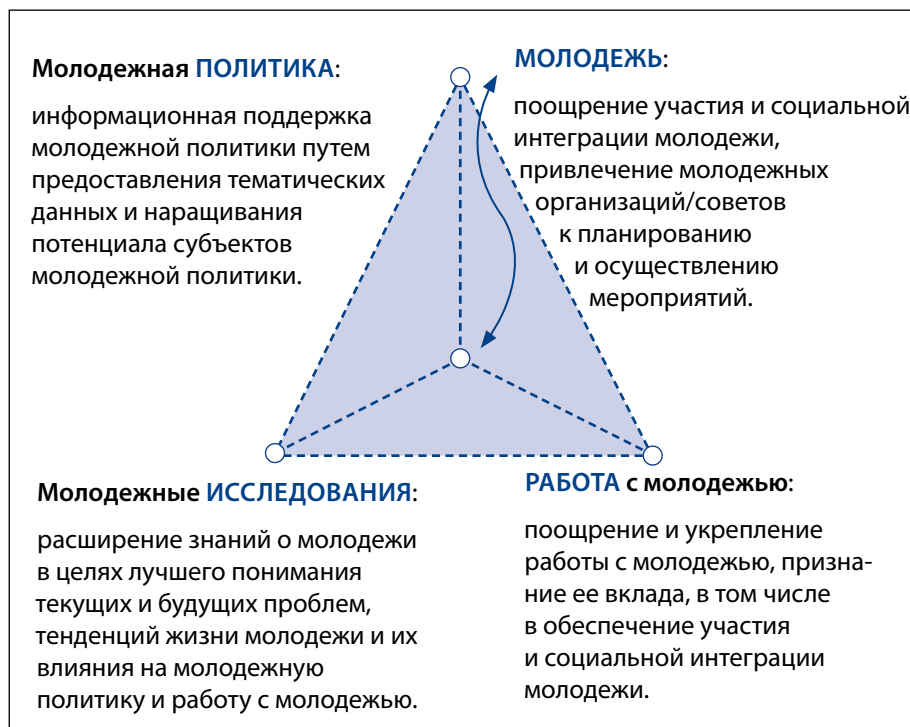
Рис. 5. Трехсторонний принцип стратегического управления

Источник: Партнерство ЕС и Совета Европы в молодежной сфере.