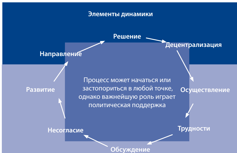
Рис. 2. Динамика молодежной политики