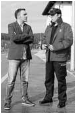
Amezaga y Alegría.