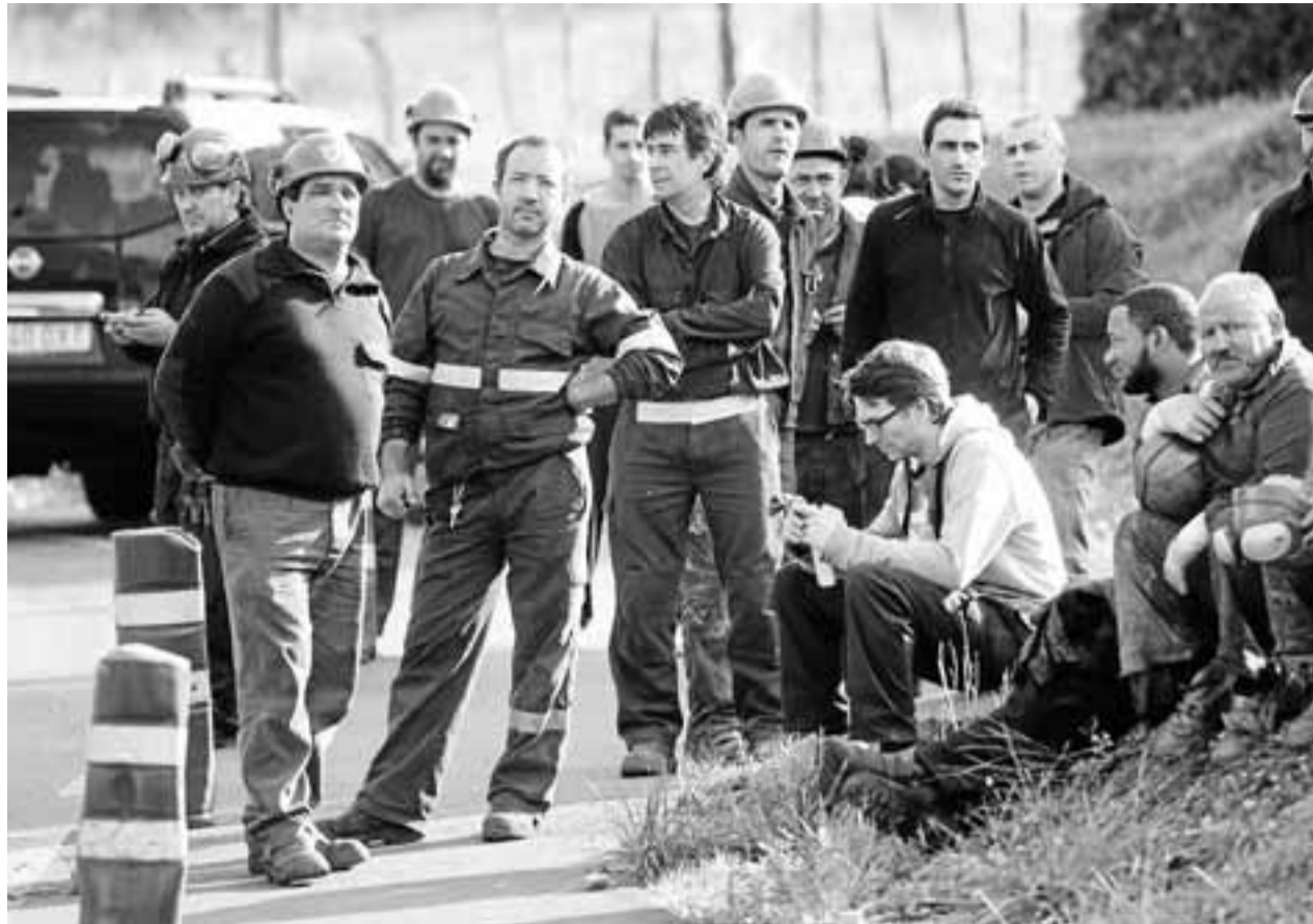
Los trabajadores fueron desalojados y esperaron a que los bomberos apagarán las llamas.

FOTOGRAFÍA – El Centro Formativo Otxarkoaga, perteneciente al Obispado, celebró ayer su 50 aniversario con la inauguración de una exposición fotográfica que recoge la vida del barrio en el Centro Harrobia. Desde su creación, más de 15.000 alumnos han pasado por las aulas del centro de enseñanza que consigue que cada año más del 75% del alumnado se titule. – DEIA