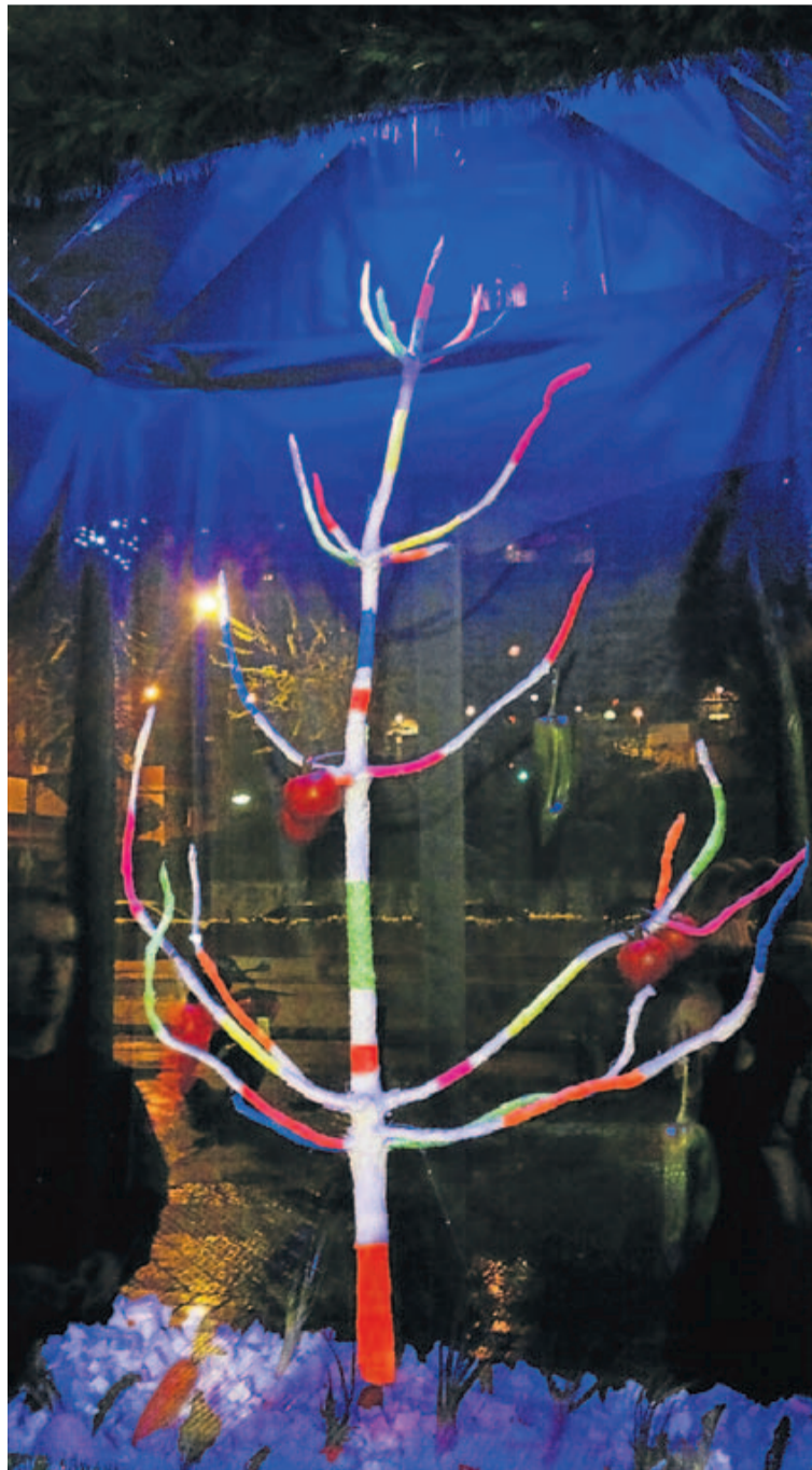
Las luces de la decoración cambian de color.