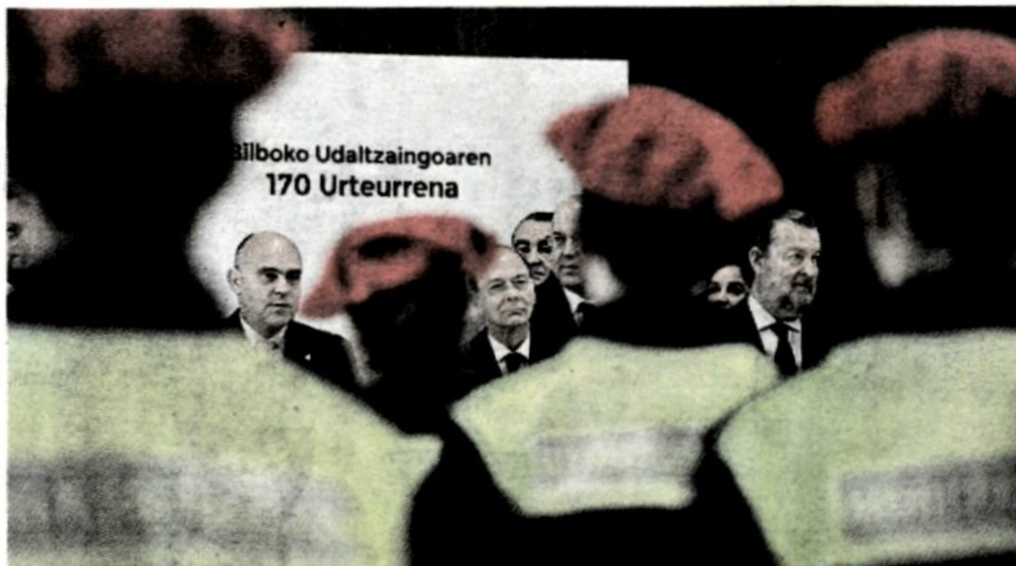
Los Policías Municipales de Bilbao se concentraron coincidiendo con el pleno.

Policías Municipales de Bilbao se concentraron ayer ante el Ayuntamiento, convocados por SVPE y CC OO, y amenazaron con tomar medidas «extraordinariamente contundentes» si el Consistorio no acomete, «de una manera urgente y seria», la negociación de la Segunda Actividad por edad. Manifestaron que «ya hay 450 policías entre 45 y 60 años» que llevan pidiendo «que se reconozca nuestra trayectoria profesional y los problemas que esos años de trabajo conllevan para los trabajadores, y que aproveche la experiencia y la formación de estos agentes en unidades especializa-