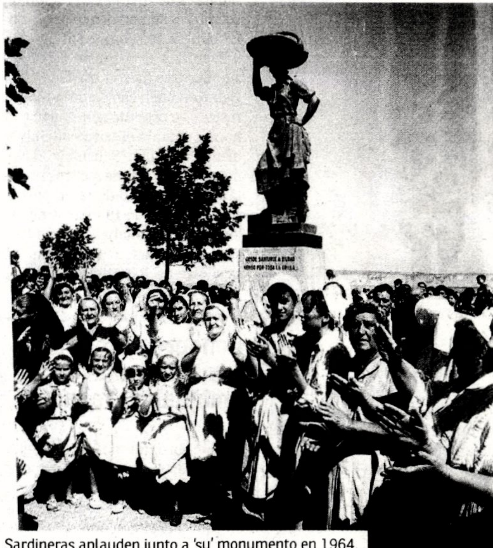
Sardineras aplauden junto a 'su' monumento en 1964.

La fiesta comenzará, a las 10 horas, con un pequeño homenaje institucional y popular. A continuación partirá una marcha que llegará a las 11.30 horas a Rialia, en Portugalete, donde se entregará un pin conmemorativo a los participantes. A mediodía, la comitiva retornará a Santurtzi, acompañada de trikitrixas. Llegará a las 12.45 horas al puerto, donde se celebrará una romería, una sardinada popular con la parrilla colocada en el muro de la rampa y una jornada de puertas abiertas en el Museo del