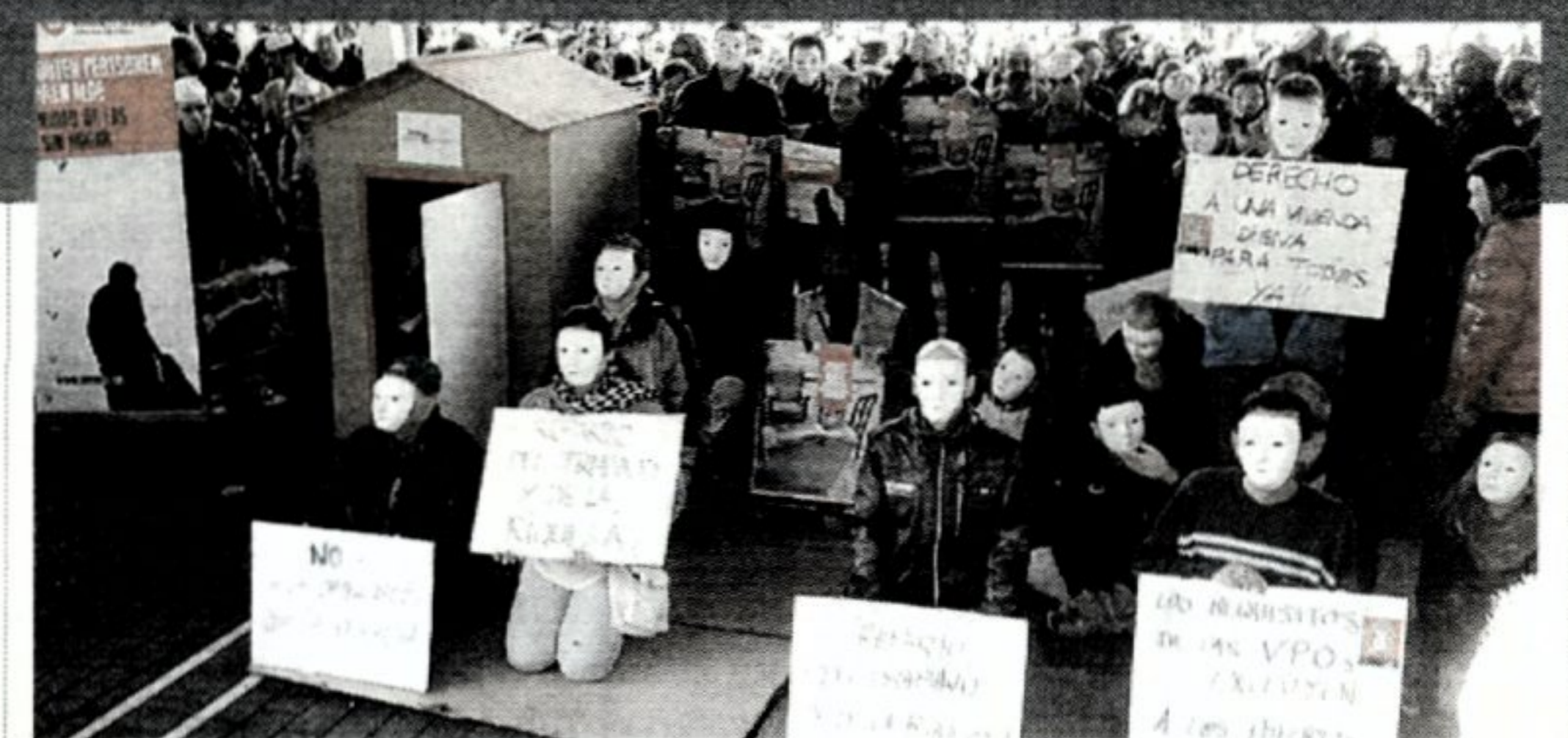
Mobilización de la plataforma Beste Bi.

8 Una adecuada planificación a través de un mapa de los servicios sociales para garantizar un despliegue adecuado a las necesidades de las personas sin hogar.