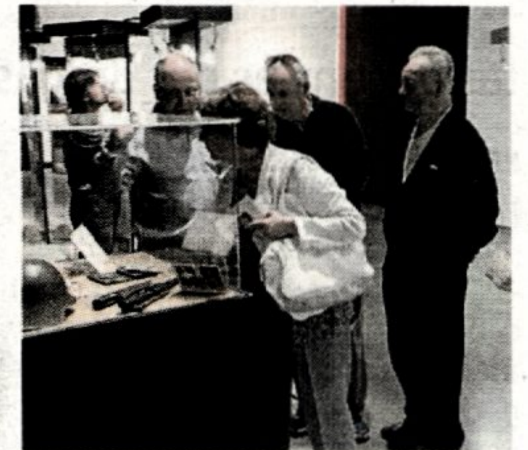
Gudako objektuak ikusgai.

Euskal gazte haien jarkierak ejerzito altxatuaren aurrera egi-