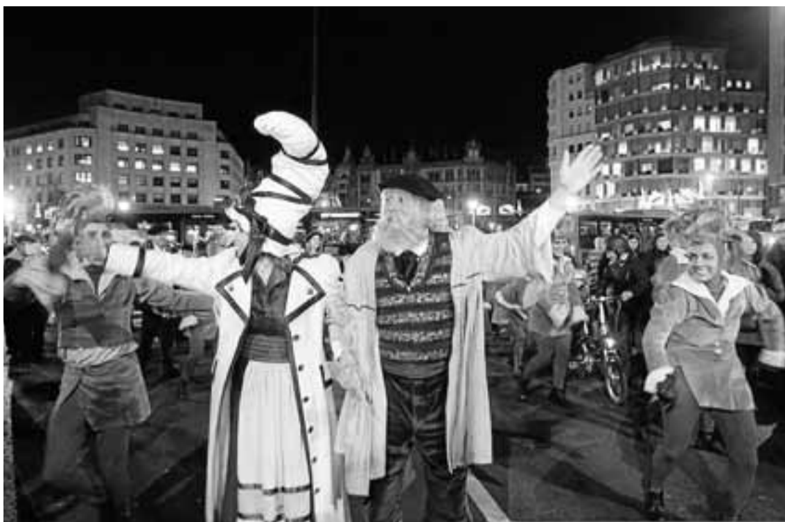
Olentzero, junto a Mari Domingi, en la kalejira del pasado año.

AYUNTAMIENTO – La estación de Abando albergará desde hoy y hasta el 15 de enero una exposición impulsada por el Área de Igualdad, Cooperación y Ciudadanía del Ayuntamiento de Bilbao y Metro Bilbao para mostrar las diferentes actividades desarrolladas en el marco de la Estrategia Europea para combatir los rumores y estereotipos frente a la inmigración. La muestra, ubicada en el acceso a Renfe, está compuesta por catorce paneles con las actividades desarrolladas con el objetivo de paliar aquellas expresiones y acciones que empañan la convivencia basada en la multiculturalidad y la diversidad. – E. P.