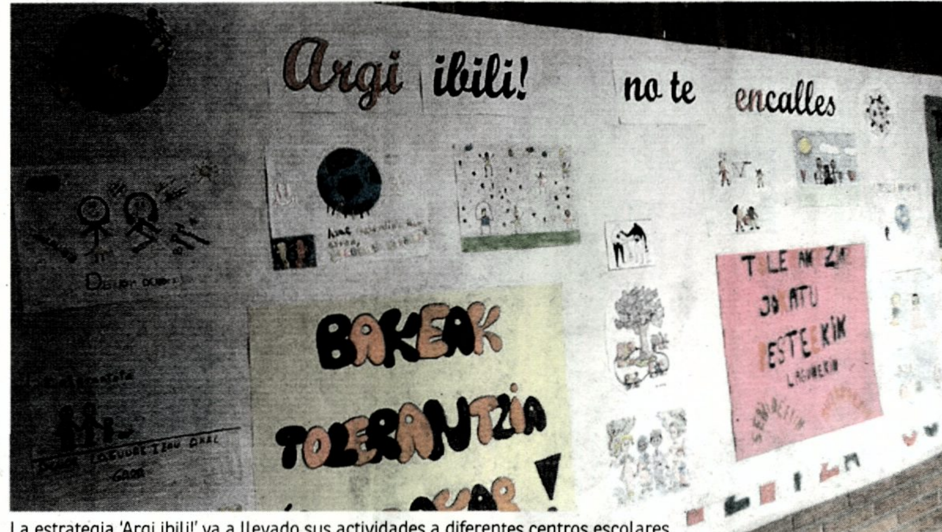
La estrategia 'Arqi ibili!' ya a llevado sus actividades a diferentes centros escolares.

La iniciativa 'Argi ibili! No te (en)calles' nació hace dos años con el fin de desmontar estereotipos y prejuicios sobre la población inmigrante, involucrando a la ciudadanía y construyendo convivencia. Las acciones de calle realizadas a lo largo de esta semana en Santurtzi y Bilbao se enmarcan dentro de la decisión de la entidad diocesana de dar paso un adelante y sacar la estrategia a la vía pública, en contacto directo con la ciudadanía. Las imágenes expuestas en la