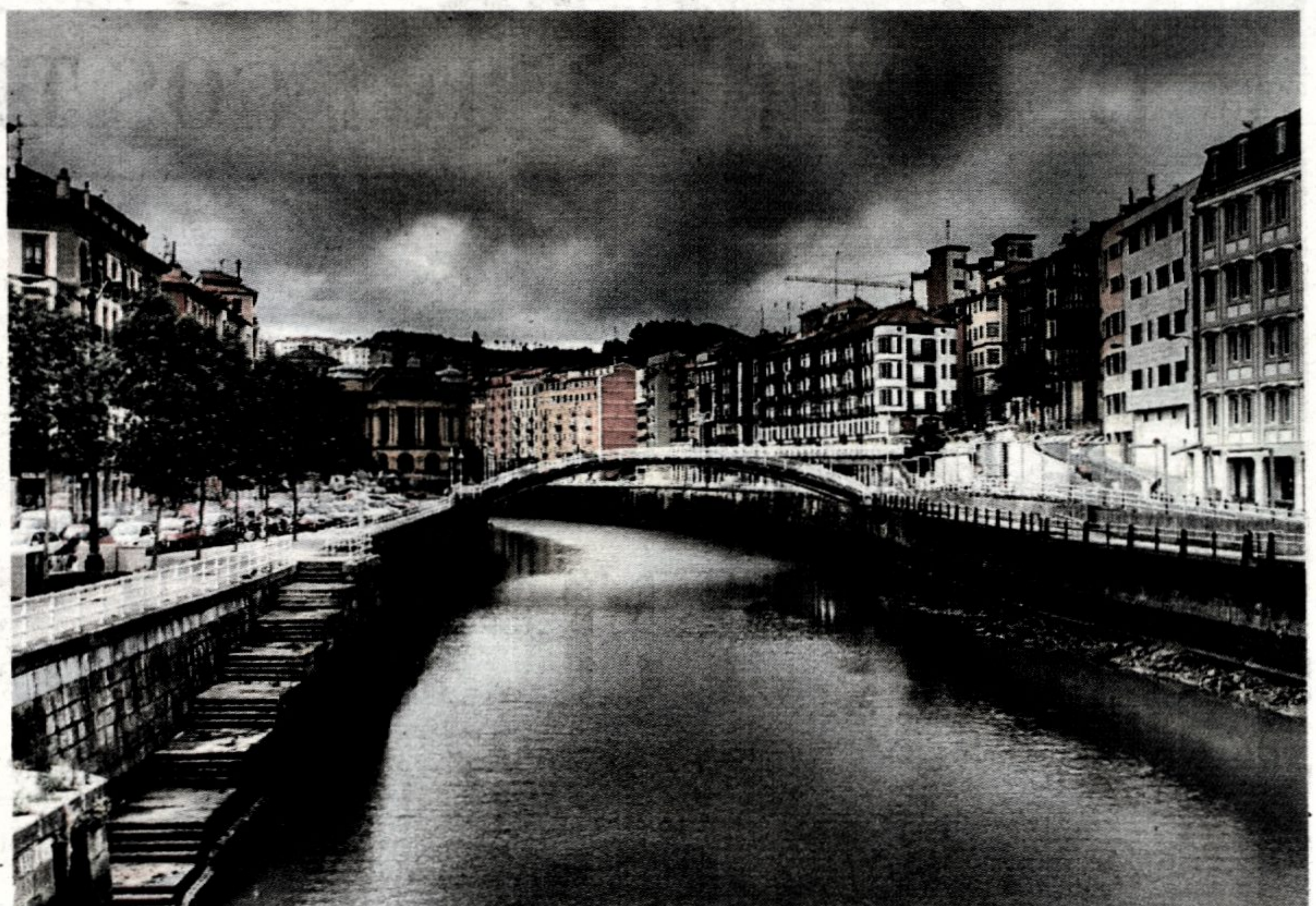
La zona cuenta con edificaciones de diferente tipología.

Quienes crean conocer la respuesta pueden participar a través del correo electrónico conocerebarrio@gmail.com o mediante papeletas que se depositarán en las urnas de los centros cívicos de San Francisco y Zabala, en la oficina municipal y en Aldauri Fundazioa. Hasta marzo, todos los meses se sorteará entre las personas que hayan acertado un bono de compra por valor de 30 euros, para su uso en alguno de los comercios locales asociados a la iniciativa. Cada participante sólo podrá dar una respuesta.